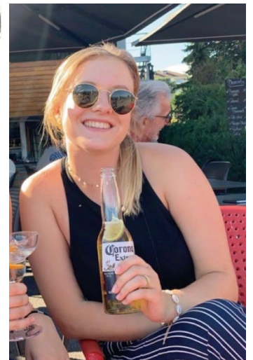
le choix de cette photo (cf la bière) est un avant-goût de mon humour

POSTE 7 : Si le poste de RRE est idéal pour moi, c'est qu'il associe « le sérieux de la fac » et « le max de fun en médecine ». Étant suffisamment sérieuse et déterminée, je pense mener à bien cette mission au vue de mon enthousiasme et de mes ambitions. Alors même si je fais 1m10 les bras levés, j'espère être à la hauteur !