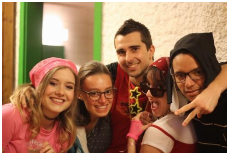
La super team délégué-e-s

Ce premier semestre (et aussi le deuxième, en espérant qu'il reste plus ou moins viable à cause de notre pote le COVID), j'ai eu la chance de faire partie des délégué-e-s de 2 ème année ! Ce fut une superbe expérience, via les nombreuses CCE auxquelles j'ai pu participer (lol), mais surtout pour pouvoir entendre les réclamations et demandes des différent-e-s étudiant-e-s, ce qui a été quelque chose de nouveau et de super pour moi.